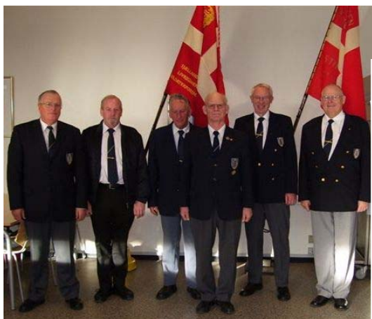
Bestyrelsesmedlemmerne ved 90 års jubilæet

Sjællandske Livregiments Soldaterforening kunne den 25. november 2007 markere sin 90 års stiftelsesdag. Det skete bl.a. ved en reception på Antvorskov Kaserne den 23. november, fra hvilken soldaterforeningen har indsendt disse fotos: