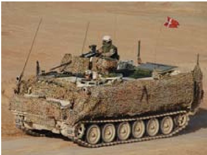
Den pansrede mandskabsvogn M113 G3 anvendes i infanterikompagniet

Hovedparten af det nye hold danske soldater er på plads i Helmandprovinsen. Det nyankomne mekaniserede infanterikompagni bliver kernen i den kommende danske bataljon i Afghanistan. En række andre danske enheder er også landet i Camp Bastion. Det drejer sig bl.a. om ingeniør-