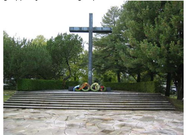
Kransenedlægning vil bl.a. finde sted på den store mindekirkegård fra den finske krig, hvor også store kendte personligheder, bl.a. Urho Kekkonen hviler.

Landsrådet har indledt forarbejdet i planlægningen af rejsen til Finland. Mulighederne for en flygrupperejse undersøges primært.