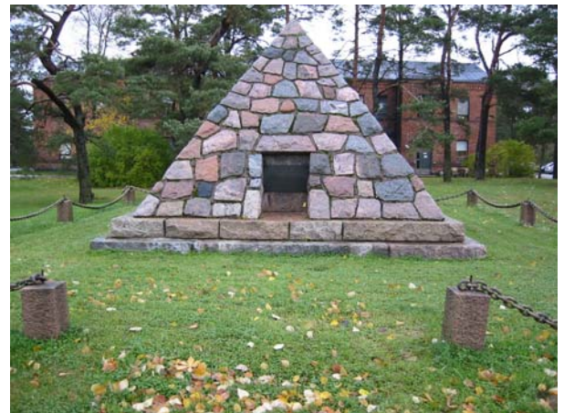
Mindeanlægget på kasernen i Sandhamn

Det danske kontingent forventes sammensat med 60 mand, der efter indstilling udtages bredest muligt blandt landsforeningerne. Indkaldelsen udsendes ultimo marts.